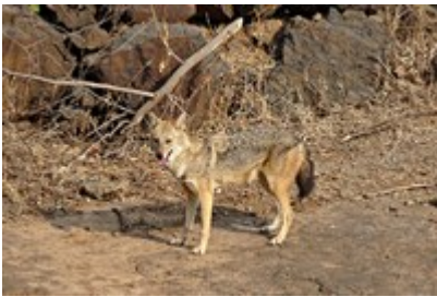
Zlati šakal – močan kot volk, zvit kot lisica

Potem ko so zlatega šakala opazili v Švici in na Predarliskem, ga je kamera za snemanje divjih živali marca ujela tudi v Lihtenštajnu. Iz prvotnega domovanja na Bližnjem vzhodu in Indiji se danes zaradi podnebnih sprememb in pomanjkanja naravnih sovražnikov širi tudi proti Alpam, kar pa povzroča nemalo nemira in težav.