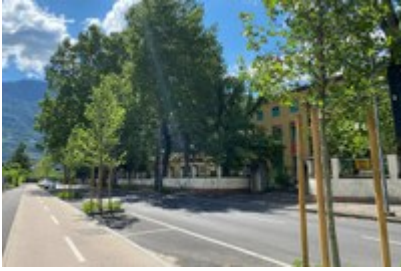
Nova drevesa skrbijo v Meranu za ugodno klimo.

Drevesa namesto parkirnih mest in podpora prebivalcem v obdobjih visoke temperature – dva od skupno 19 ukrepov, s katerimi se Merano spoprijema s posledicami podnebnih sprememb. Strategija prilagajanja je bila izdelana v sodelovanju s strokovnjaki, različnimi interesnimi skupinami in predstavniki mladih.