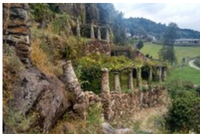
Terasirana pobočja v občini Alto Canavese

V terasiranih pokrajinah se odražajo ustvarjalnost in prizadevanja celotnih generacij, da bi živele skladno z gorskim svetom, ne da bi pri tem uničevale njegovih bistvenih prvin. Zahtevo po njihovem varstvu vsebuje tudi nov manifest.