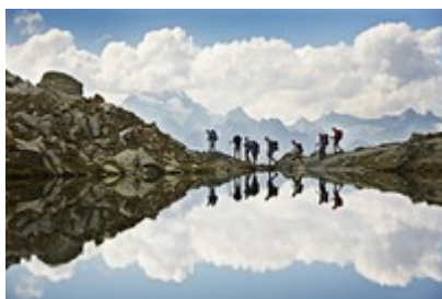
Peš po sledih sprememb v Alpah

1992. Spremembe v Alpah bo tako mogoče ne le spoznati, temveč tudi izkusiti na kraju samem. Skupini whatsapp se lahko seveda priključijo vsi, ki bi jih potovanje zanimalo. O doživetjih in srečanjih na potovanju bodo udeleženci redno poročali na naslovu whatsalp.org in prek medijev CIPRE.