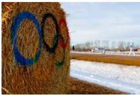
Odločen »ne!« olimpijskim igram: Tirolci so zavrnili kandidaturu za zimске olimpijske igre 2026.

Prebivalci Tirolske so zavrnili kandidaturu za organizacijo zimskih olimpijskih iger v letu 2026. Tudi veliki športni dogodek se tudi sicer srečuje z velikim odporom na celotnem območju Alp.