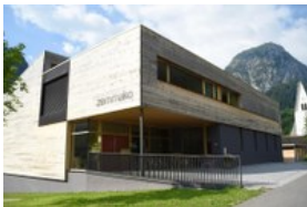
Brand/A: Stavbi, v kateri je osnovna šola, je žirija Constructive Alps podelila najvišjo oceno.

Konec oktobra 2017 so v Bernu v Švici razglasili zmagovalce, ki so se potegovali za mednarodno arhitekturno nagrado Constructive Alps. Nagradjeni projekti so primer kakovostne alpske arhitekture, ki ni samo estetsko dovršena, marveč spoštuje tudi načela in zahteve trajnostnega razvoja.