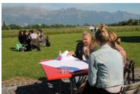
Vključevanje in spodbujanje mladih k oblikovanju kakovostnega življenja v Alpah

CIPRA po eni strani izpostavlja potencial EUSALP kot prostor za udejanjanje trajnostnega razvoja in zahteva, da si ne bi smeli prizadevati za gospodarski razvoj, ki bi škodil ekološki in socialni dimenziji trajnostnega razvoja. Vedno znova se pojavljajo zagovorniki kratkoročnih idej in finančno potratnih spodbud za gospodarsko rast, kot so gradnja avtocest, smučišč ali turističnih atrakcij na alpskih zavarovanih območjih, pri čemer jih zastopa pisana družina akterjev. Gospodarstvo kot podsistem naše družbe ima velik pomen za razvoj alpskega prostora in povezanost družbe, vendar pa ne sme pretehtati bogate biotske raznovrstnosti, čistega zraka, trajnostne mobilnosti ali neokrnjenih pokrajin, še navaja pismo.