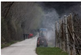
Zahteve, da mora postati Tirolska dežela brez pesticidov, postajajo vse glasnejše.

Študija okoljevarstvene organizacije je odkrila pesticide na južnotirolskih otroških igriščih. Deželna uprava avtonomne pokrajine se brani očitkov.