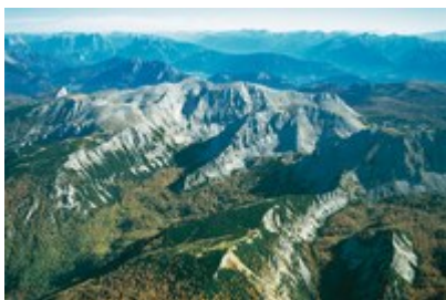
Warscheneck je eno najpomembnejših kraških območij v Evropi, severni del (na sliki) je zaščiten od leta 2008 dalje.

Aprila je Zvezna dežela Zgornja Avstrija javnosti predstavila pravno mnenje o načrtovani širitvi smučišča Höss – Wurzeralm, s tem pa je ta primer zaključen.