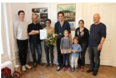
Nagrada CIPRE Švica, ki je bila

Da lahko trajnostni turizem v Alpah prinaša uspeh, kažejo nenavadni projekti iz Švice, ki so prejeli nagrado CIPRE Švica za leto 2017.