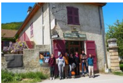
CIPRA Francija s tremi upravljavci trgovine v francoski vasi Saint-Martin-de-la-Cluze.

Za idejo se je odločilo devet posameznikov iz povsem različnih okolij in predstavilo skupni projekt. Presenečenje je bilo seveda veliko. Novi lastniki so medtem razširili ponudbo in se povezali z lokalnimi proizvajalci. Chez Jeanne je zdaj tudi gostinski lokal in kraj za srečanja. Vaščani neprofitni skupnosti zaupajo in jo podpirajo z lastnimi idejami.