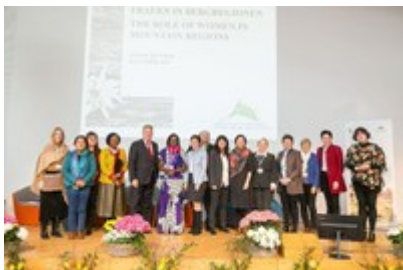
Na konferenco o vlogi žensk so v avstrijski Alpbach pripotovale predstavnice gorskih regij z vsega sveta.

Avstrijsko predsedstvo je z mednarodno konferenco in deklaracijo o vlogi žensk v gorskih regijah na dnevni red Alpske konvencije postavilo novo temo, s tem pa vzbudilo velika pričakovanja. Kateri so naslednji koraki?