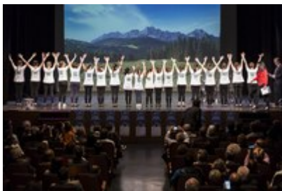
Alpsko mesto leta Tolmezzo/I bo posebno pozornost posvetil mladim.

Konec aprila je italijanski Tolmezzo/Tolmeč postal alpsko mesto leta 2017, obenem se je začel izvajati projekt Tour des Villes. Letni program društva Alpsko mesto leta tudi sicer obljublja veliko, Tolmezzo pa je podelitev naziva že upravičil.