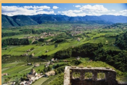
Občina Eppan/I se je izkazala kot izvrstan gostiteljica Letnega srečanja Omrežja občin.