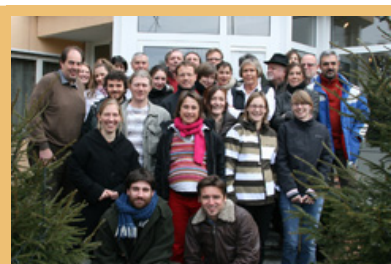
V Balzersu smo poznanstva sklepali na zelo okusen in zabaven način.