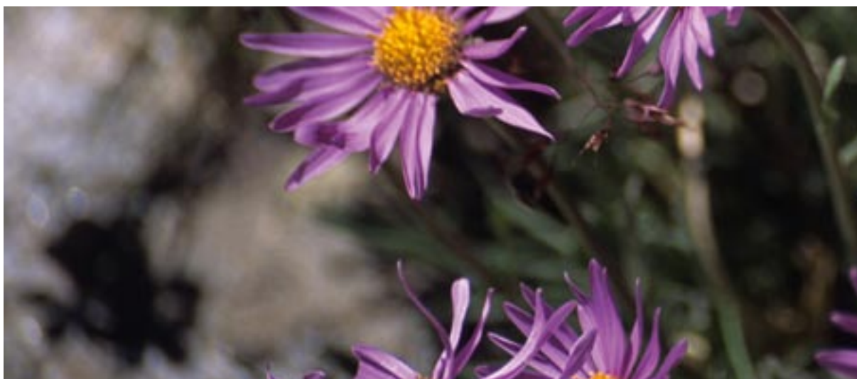
Alpska astra ali nebina ( Aster alpinus ) raste na suhih toplih in apnen astih tleh do nadmorske višine 3100 metrov.