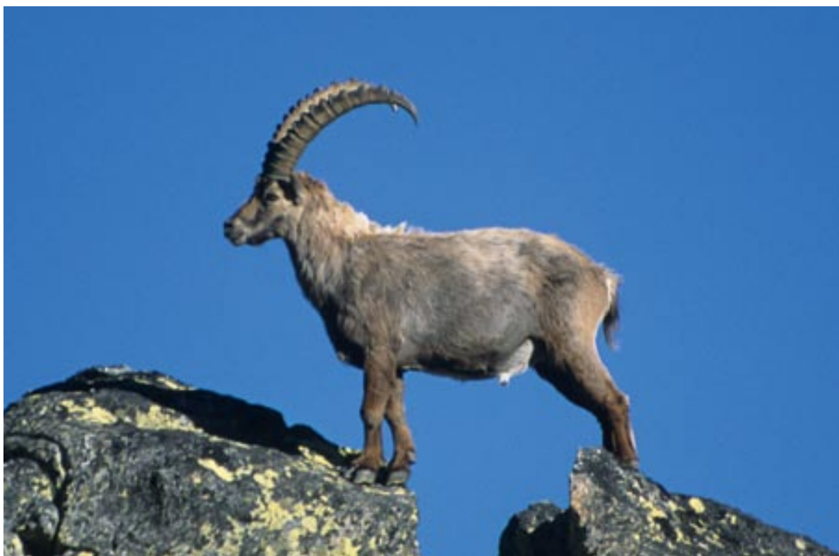
Alpski kozorog ( Capra ibex ).

Kmetje upravičeno pričakujejo, da bodo od prodaje svojih pridelkov na trgu in od nagrad za socialne storitve, ki so si jih zagotovili, dosegli primeren dohodek. Za umiritev cen in zaščito pred velikimi cenovnimi nihanji je potrebno nastaviti učinkovite tržne instrumente. Pridelavo in prodajo kakovostnih izdelkov je potrebno podpreti s poudarkom na regionalnosti in raznolikosti kmetijskih področij. Zveza za kmetijstvo in varstvo narave v Alpah zahteva celo prepoved zavajajočega oglaševanja kot tudi večjo podporo krajšim dostavnim potem, pobudam za neposredno prodajo in regionalno umeščenim kmečkim tržnicam. Posebej za hribovsko kmetijstvo je potrebna zaščitna blagovna znamka, s katero bodo označeni izdelki iz trajnostne pridelave. V zakonodajnem predlogu je prav tako predvideno okrepljeno subvencioniranje združenj proizvajalcev in šolskega mlečnega programa. Slednji bi lahko, zaradi visokih kriterijev glede kakovosti šolskega mleka (regionalno bio- mleko ali regionalno mleko s pašnikov) razvili še večji krmilni učinek. Zaključimo lahko, da moramo okrepiti konkurenčnost kmečke dejavnosti in se soočiti z vsemogočno pogajalsko pozicijo velikih trgovskih verig.