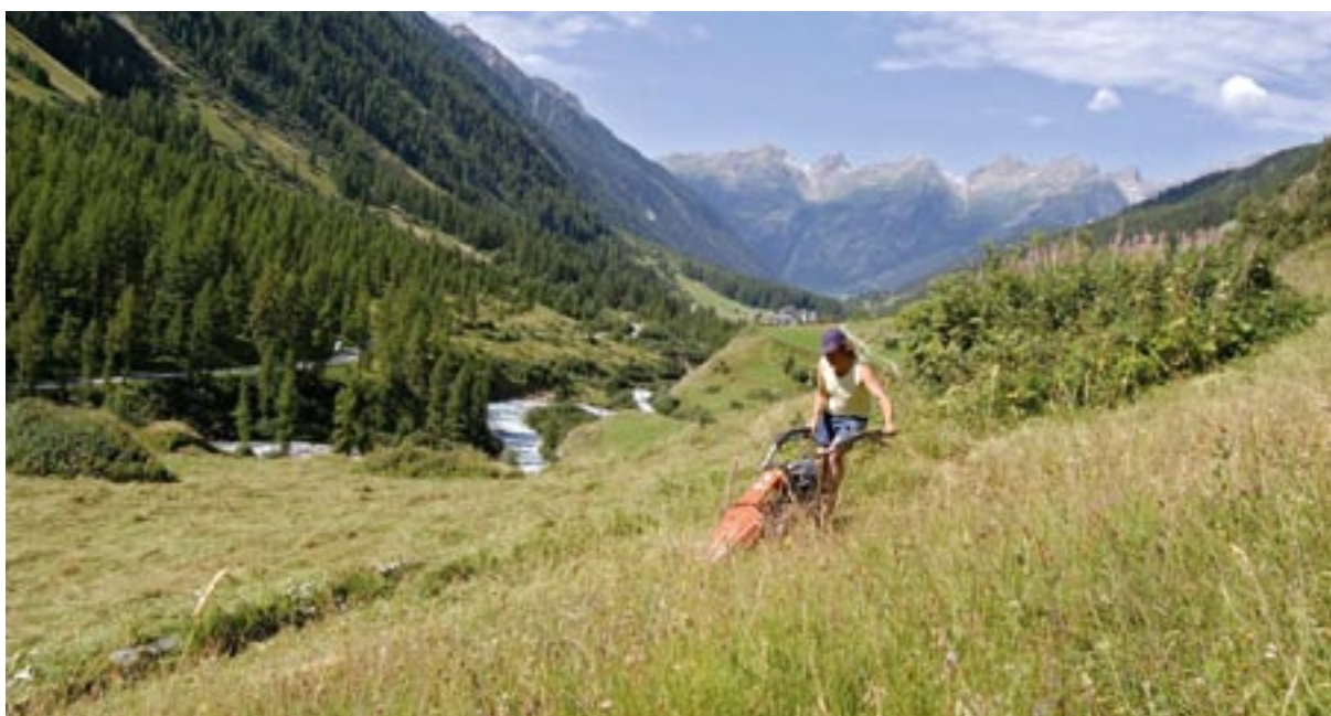
Na pobočjih švicarskih Alp uporabljajo motorne kosilnice.